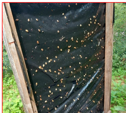
Trappola di cattura massale per cimice asiatica