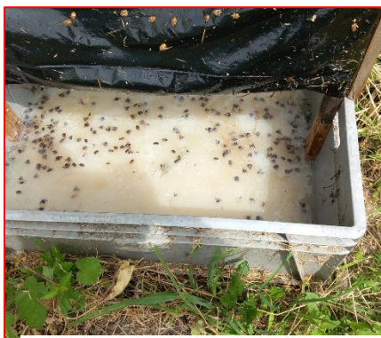
Trappola di cattura massale per cimice asiatica