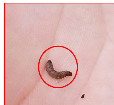
Larva di Euzophera spp. - areale Garda

N.B. Per i trattamenti fitosanitari seguire sempre le dosi d'etichetta e rispettare i tempi di rientro e di carenza e tutti gli accorgimenti per un corretto uso dei P.F.