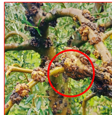
Tubercoli neoformati di Rogna -areale Garda

Sospendere i trattamenti fitosanitari. A raccolta ultimata per combattere le infezioni fungine, si consiglia di intervenire urgentemente con PRODOTTI RAMEICI e ZOLFO , in alternativa in convenzionale si può procedere ad eseguire un intervento con prodotti curativi a base di DODINA o FOSFONATO DI POTASSIO.