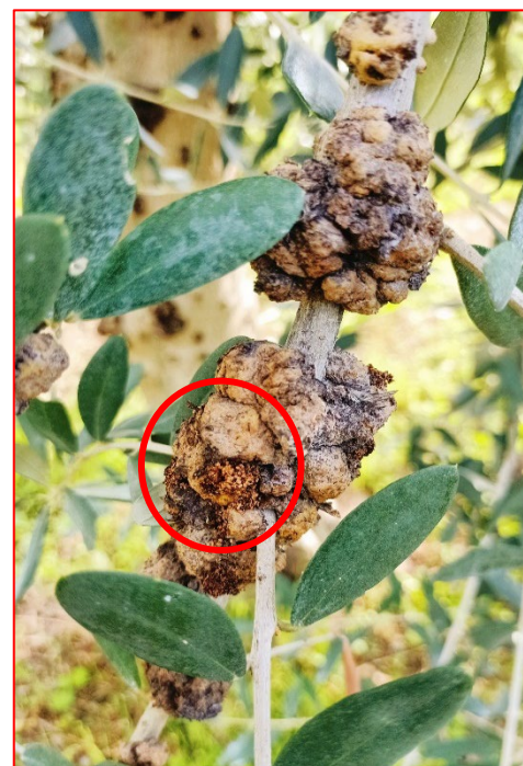
Danno da Euzophera su olivo, sono ben visibili le deiezioni dell'insetto - areale Garda