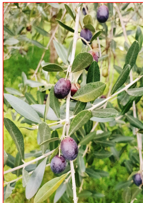
Fase fenologica, varietà Leccino - areale Garda

Per garantire la migliore qualità possibile dell'olio prodotto è consigliabile conferire olive sane al frantoio entro le 24 ore dalla raccolta in maniera che possano essere lavorate il prima possibile. È consigliabile inoltre utilizzare contenitori forati in grado di far circolare l'aria ed evitare l'utilizzo di sacchi che compattano le olive e favoriscono i processi di fermentazione che possono comportare l'insorgenza di difetti sensoriali e chimici nell'olio prodotto .